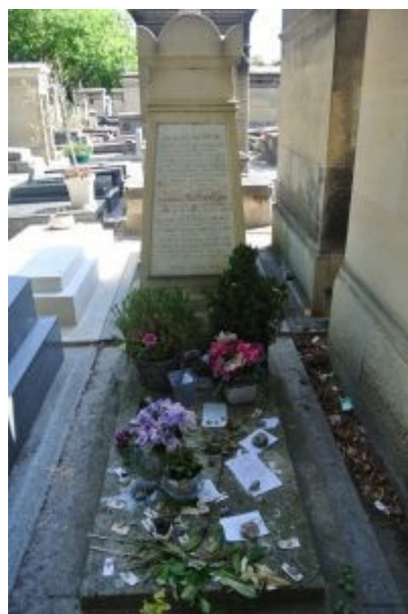
Charles BAUDELAIRE 1821-1867 6e division