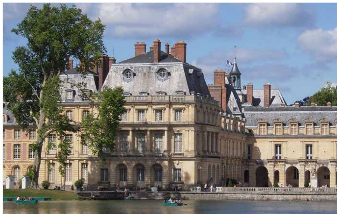
Ange-Jacques Gabriel. Le gros Pavillon. 1750 / 1754.

Il ne reste rien du petit salon de Madame du Barry édifié dans le jardin de Diane de 1772 à 1773. Ce