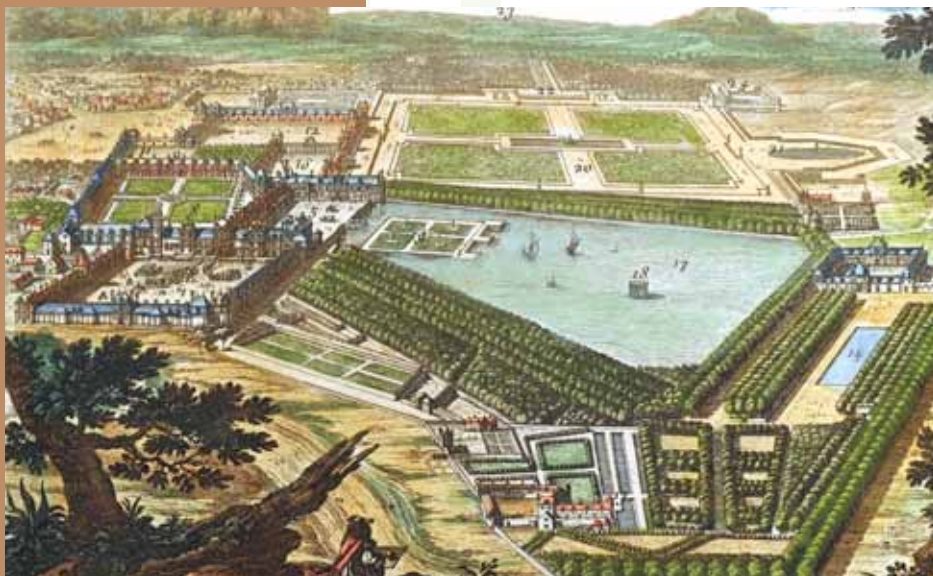
Estampe de Patel, gravée par Pérelle vers 1660 Archives du Château