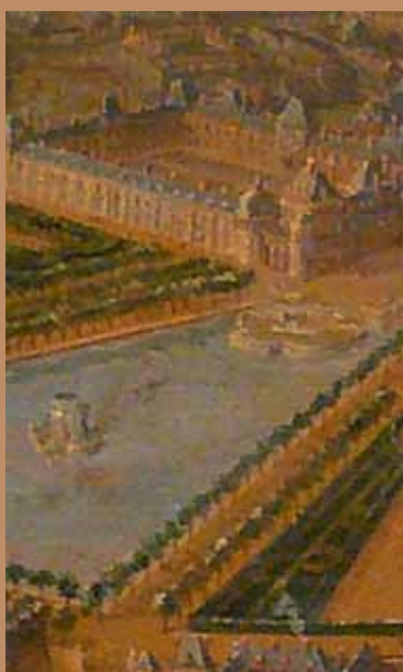
Pierre Denis Martin - Vue de la maison royale de Fontainebleau (détail) Musée Ephrussi-Rothschild, St Jean Cap Ferrat