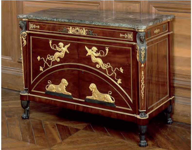
D'après Guillaume Benneman (1750-1811), Commode à vantaux. Acajou. Château de Fontainebleau.

Si les princes se contentent bien volontiers dans un premier temps des meubles livrés sous le Premier Empire, l'ameublement des appartements des Chasses va se caractériser par sa grande mobilité tout au long du règne, justifiée par la croissance des enfants royaux, mais aussi par le mariage des uns ou les études militaires des autres. Tout au plus peut on constater une livraison insigne pour le duc d'Aumale en 1837, une commode et un secrétaire par Guillaume Benneman provenant des Tuileries, révélant, si l'on en doutait encore, un aménagement toujours soigné. Rendant de plus les inventaires, fixes par nature, très relatifs, les appartements des jeunes princes vont être largement ouverts aux invités de passage, entraînant son lot d'ameublements provisoires au gré des arrivées et des départs : la future