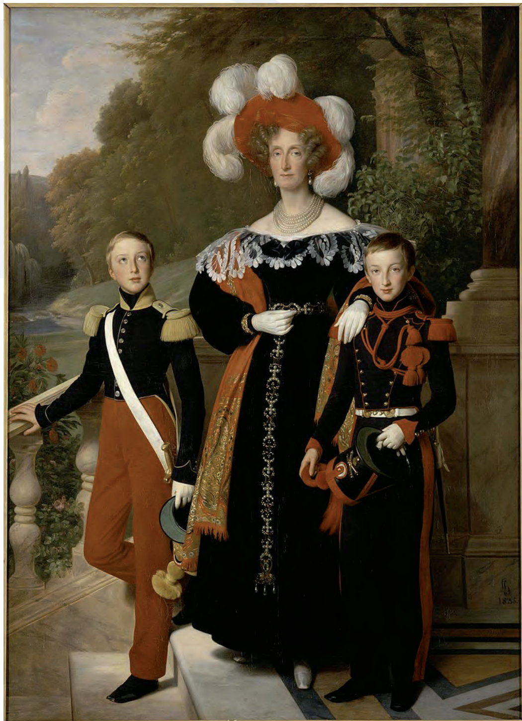
Hersent Louis, La Reine Marie-Amélie et deux de ses fils. Le duc d'Aumale en uniforme de soldat de l'infanterie légère et le duc de Montpensier en uniforme d'artilleur, devant une vue du parc du château de Neuilly. Château de Versailles.