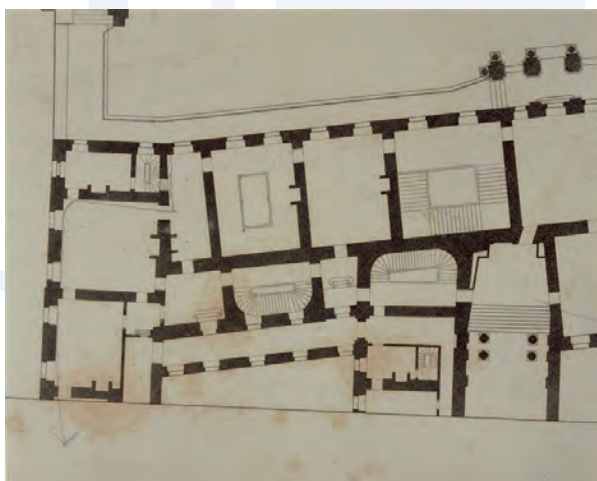
Plan de l'appartement des chasses (1 er étage) après les travaux, 1836.