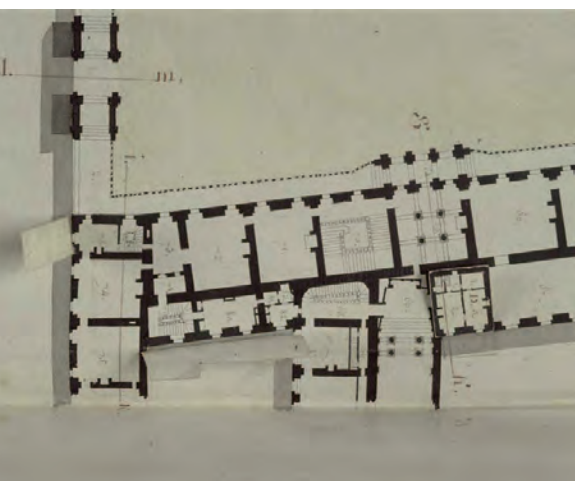
Plan de l'appartement des chasses (1 er étage) avant les travaux, 1810.