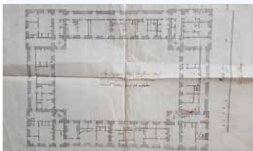
Plan du Premier étage du Chenil Neuf. Les Changements acordée et ordonnés par Mr Potain en 1784.

- Plan intitulé : Plan du Premier étage du Chenil Neuf. Les Changements acordée et ordonnés par Mr Potain en 1784.