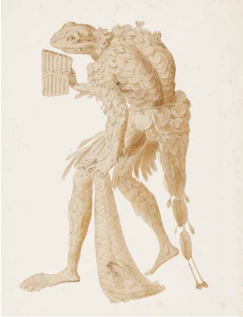
Nicolo dell'Abbate, L'Homme grenouille , crayon, encre noire et lavis brun, Stockholm, Nationalmuseum.

L'exposition que le château de Fontainebleau proposera, du 10 avril au 4 juillet 2022.