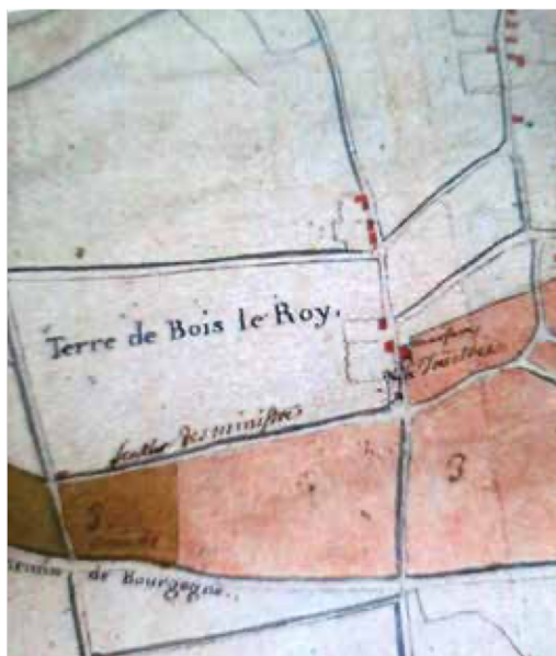
1719 : Bois le Roi. « Plan et arpentage des bois, terres et bruyères, appartenant aux ministres (charte de 1270) par Desquimare, situés au pourtour et environ de la Forêt de Bière ». Le carré rouge à gauche pourrait être un reste du temple détruit. (Archives Départementales de Seine-et-Marne, cote H127).

Il ne reste aujourd'hui aucune trace du temple, seul demeure le souvenir du nom de la rue de la Presche. On suppose une grange aménagée, solution souvent choisie pour faire vite, ressemblant à celle de Nanteuil-lès-Meaux, avec ses murs bas, son long toit, sa grande porte et ses petites fenêtres cintrées, les tables de la Loi sur le pignon et à l'intérieur, une chaire. Le tout était bien inconfortable, « grandement incommode »