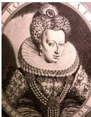
Thomas de Leu (1555 ? 1612 ?), Portrait de Catherine de Bourbon, estampe