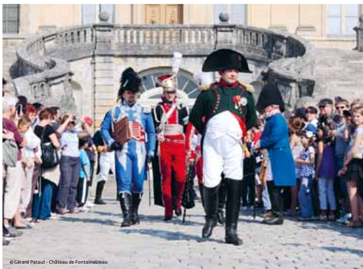
© Gérard Pataut - Château de Fontainebleau

Retrouvez le programme complet sur le site www.chateaufontainebleau.fr dès septembre