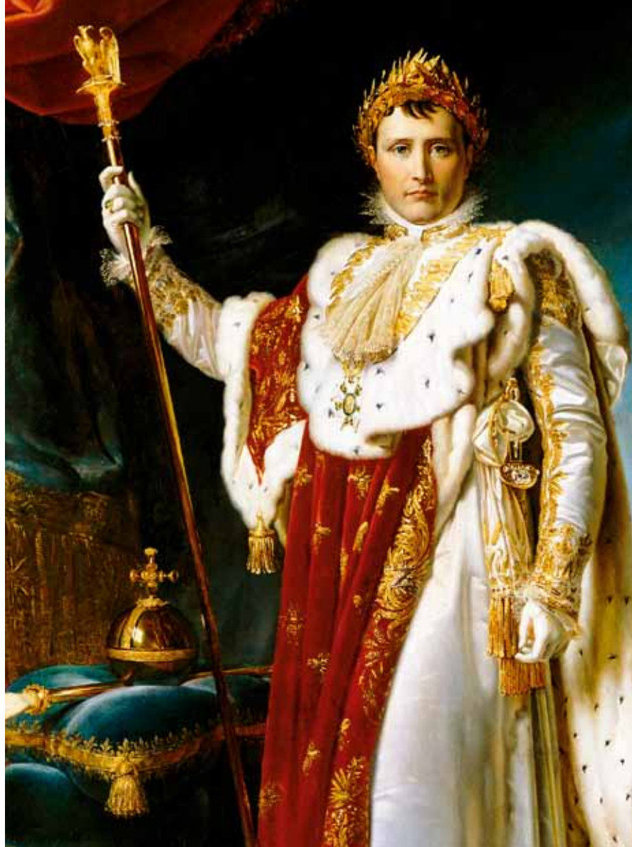
1. François Gérard (1770-1837) (atelier de) Napoléon I er en costume de sacre