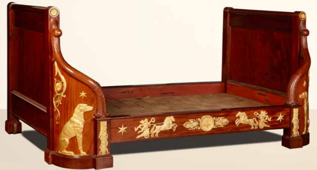
Jacob-Desmalter / 1806 / Acajou, bronze doré. Hauteur 107 cm / Largeur 210 cm / Profondeur 136 cm